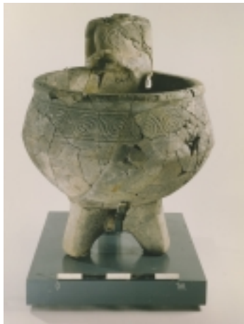
פסל אל כנעני

כתיבה: פרופ' אמנון בן-תור ורוחמה בונפיל;