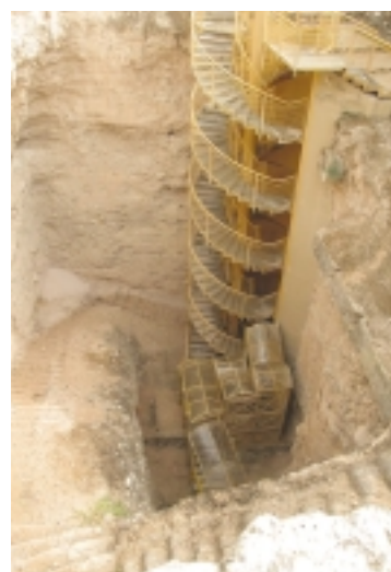
מפעל המים של חצור - המדרגות המקוריות ומתקן הירידה המודרני

יאשיהו מלך יהודה הרס במאה ה-7 לפסה"ג במות הניצבות ליד שערים במהלך הרפורמה הדתית שערך: "...וַיִּטְמֵא אֶת-הַבָּמֹת אֲשֶׁר קָטְרוּ-שָׁמָּה הַכְּנַעֲנִים, מִגִּבְעַת עַד-בְּאֵר שָׁבַע; וַיִּתֵּץ אֶת-בָּמֹת הַשָּׁעָרִים..." (מלכים ב' כ"ג 8).