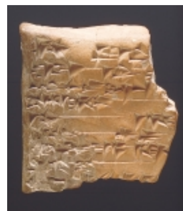
מכתב לאֶבְנִי (אֲדֹם) מֶלֶךְ חֹצוֹר(?) מאה 18 לפסה"ג

הגג מגן על הארמון הכנעני הטקסי, ששימש את מלכי חצור במאות 13-14 לפסה"ג. בחלק המערבי של חצר הארמון, מול פתחו, נמצאת במת הפולחן. בראש המדרגות המובילות לארמון התגלו שני בסיסי עמודים ענקיים מבזלת. במרכז הארמון נמצא חדר הכס. קירות הארמון בנויים לבנים ובסיסיהם מצופים בלוחות מסותתים של בזלת, שמעליהם הונחו קירות ארזים. בחפירות שנערכו בארמון התגלו, בין השאר, כתובות בכתב יתדות המוטבעות על לוחות טין, פסלים מאבן ומברונזה ותכשיטים. הארמון חרב בשרפה אדירה במאה ה-13 לפסה"ג. במבט מזרחה מחצר הארמון נראים קירות אבן עבים העוברים מתחת לחצר. אלה הם שרידי של מבנה מונומנטלי קדום יותר. ייתכן שזהו ארמונו של אותו אֶבְנִי-אֲדֹם, הנזכר בתעודות שנתגלו במארי. מדרום להם נראה מקבץ מצבות אבן ולידן שולחנות מנחה. זהו מכלול פולחני מתקופת הברונזה התיכונה.