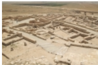
תל באר שבע – מראה כללי