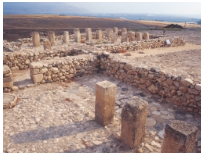
בת פרטי ומבנה ציבורי מהתקופה הישראלית

"...כי-חצור לפנים היא, ראש קל-הממלכות האלה" (יהושע ו"א 10)