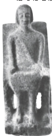
פסל מאבן בולת. תקופת הברונזה המאוחרת