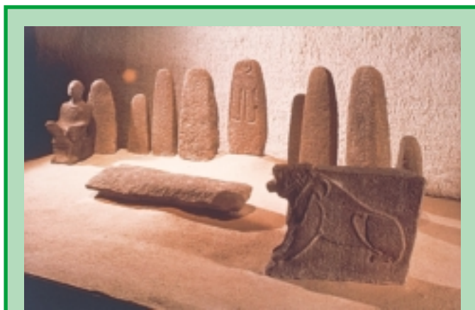
אל או מלך, מצבות פולחן ואריה ממקדש בעיר התחתונה

המגדל הנראה בקצה המערבי של התל הוא שריד הבנייה הישראלית המאוחר ביותר שנבנה בחצור. המגדל נבנה כחלק ממערך ההגנה שנועד לקדם את פני הצבא האשורי, אך בסופו של דבר הצליחו האשורים לכבוש את חצור. "בְּיָמַי פָּקַח מֶלֶךְ-יִשְׂרָאֵל, בָּא תְּגַלֵּת פְּלֶאֶסֶר מֶלֶךְ אַשּׁוּר, וַיִּקַּח אֶת-עֵינָיו וְאֶת-אֶבְלֵ בֵּית-מַעֲכָה וְאֶת-יְנוּחַ וְאֶת-קִדְשׁ וְאֶת-חֹצוֹר וְאֶת-הַגִּלְעָד וְאֶת-הַגְּלִילָה, כָּל אֶרֶץ נַפְתָּלִי; וַיְגַלֵּם, אֲשֶׁרָה" (מלכים ב' ט' 29).