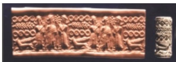
חותם שנמצא בארמון הכנעני, המתאר סצנה פולחנית

לא רק תעודות מעידות על גדולתה של חצור הכנענית, אלא גם, ואולי בעיקר, הממצאים שהתגלו בחפירות. העיר הענקית הייתה מבוצרת בסוללות עפר ובחומות. נמצאו בה ארמונות, מקדשים, בתי מגורים, כלי חרס, פסלים, כלי נשק, תכשיטים וחפצי אמנות רבים. הממצאים מעידים על הקשרים הנרחבים של חצור עם סוריה, מצרים, ממלכת החיתים, בבל ועם ארצות הים התיכון – כרתים, יוון וקפריסין. קשרים אלה הקנו לחצור את התואר "ראש כל הממלכות האלה" (יהושע ו"א 10) ומלך חצור זכה בתואר "מלך כנען" (שופטים ד' 2).