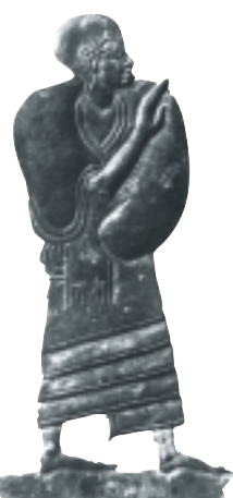
לוחית ברונזה המתארת אציל כנעני. תקופת הברונזה המאוחרת

החוקר האירי לזלי פורטר זיהה לראשונה את חצור המקראית עם תל אֶל-קֶדַח (1875). בשנת 1928 ערך הארכיאולוג הבריטי ג'והן גרסטאנג חפירה קצרה במקום. משלחת מטעם האוניברסיטה העברית, בראשות יגאל ידן ובמימון קרן רוטשילד, ביצעה בתל את החפירה הנרחבת הראשונה (1955-1958, 1968-1969). החפירות התחדשו בשנת 1990 בידי משלחת בהנהלת אמנון בן-תור. חפירות קרן זלץ בחצור לזכר יגאל ידן נערכות מטעם האוניברסיטה העברית, בחסותה של החברה לחקירת ארץ ישראל ועתיקותיה. למימון החפירות מסייעים קרן זלץ (ניו-יורק), קרן אנטיקוואה (ז'נבה), קרן ברמן (האוניברסיטה העברית), קרן הכס וגורמים פרטיים.