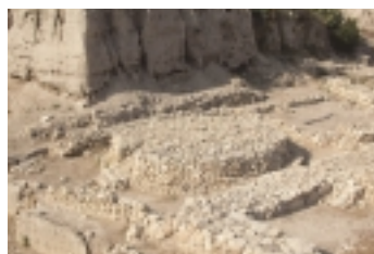
תל מגידו – במת פולחן כנענית