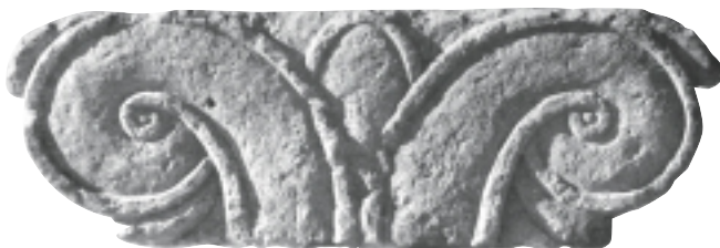
אחת משתי כותרות התימורה שעיטרו את שער הכניסה למצודה הישראלית

בקצה המערבי והגבוה של העיר העליונה נחשפו שרידים של מצודה שנבנתה ככל הנראה בימי אחאב (המאה ה-9 לפסה"ג). השער המונומנטלי שכלל סף, מזוזות, כותרות מסוגנות (שכמותן נמצאו גם במבני ציבור במגידו, בשומרון ובירושלים) ומשקוף, הועברו למוזיאון ישראל בירושלים. המצודה הנראית כיום באתר – ממנה שרדו היסודות בלבד – נבנתה על שרידי מצודה קדומה יותר ומעל לחומת הסוגרים המיוחסת לימי שלמה. המצודה נהרסה יחד עם העיר כולה בידי תגלת פלאסר ה-3, מלך אשור, בשנת 732 לפסה"ג.